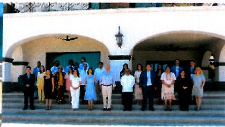
Fotografía oficial de las y los participantes.