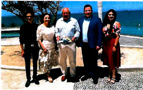
Fotografía de la comisión del Sonora junto al gobernador de BCS.

Derivado de la participación en la Primera Reunión de la Región Noroeste de la Comisión Permanente de Contralores Estados-Federación donde las entidades federativas dieron a conocer sus acciones sobre el Control Interno, así como de contrataciones públicas transparentes y su impacto en la obra pública de los entes públicos. Derivado de lo anterior, se presentó el proyecto de Registro Actualizado de Proveedores y Contratistas Sancionados. Por parte del estado de Sonora se expuso el programa Brigadas de Integridad como ejemplo de supervisión a la obra pública e infraestructura de los espacios públicos, entre otros.