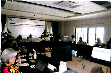
Fotografías del desarrollo de la sesión.